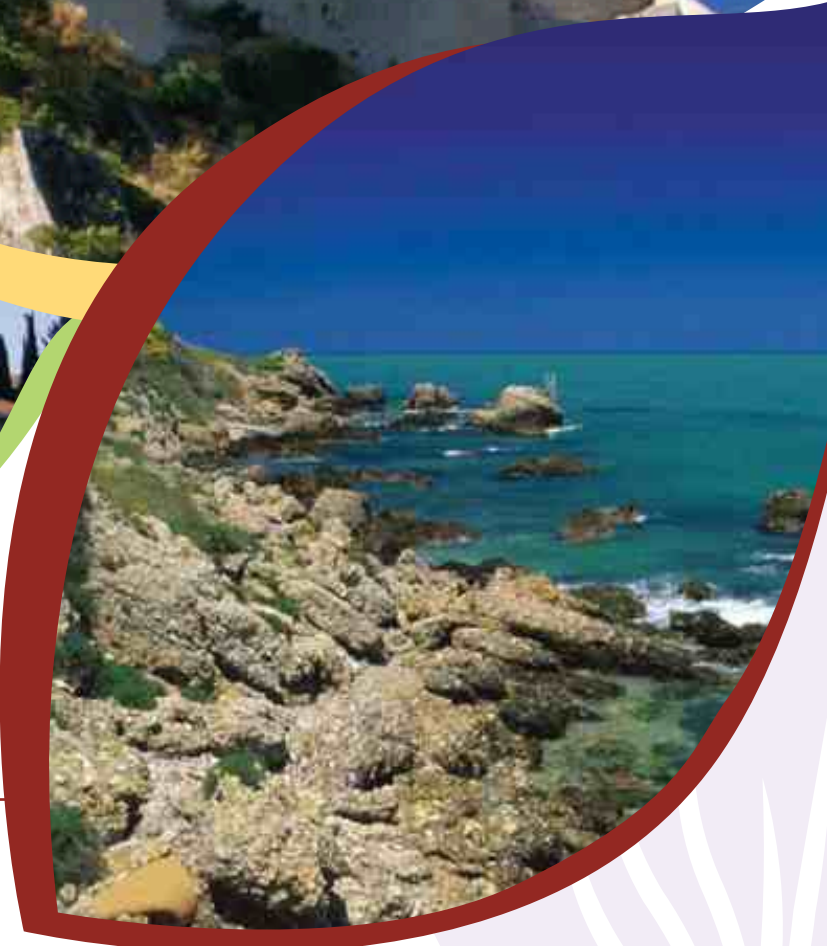
Riserva Naturale Punta Aderci Nature Reserve Punta Aderci

■ Niché dans une verdure luxuriante, le Camping Village Santo Stefano est le cadre idéal pour les familles qui souhaitent garder le contact avec la nature, où les enfants peuvent jouer en toute liberté et sécurité.