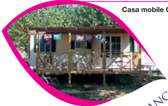
Casa mobile Cor