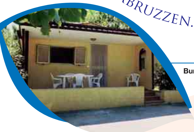
Bungalow Stella Marina

Der Camping Village Santo Stefano , mit seiner üppigen Pflanzenwelt, ist ideal für Familien, die einen Urlaub im grünen der Natur verbringen möchten, wo die Kinder spielen können in voller Freiheit und Sicherheit.