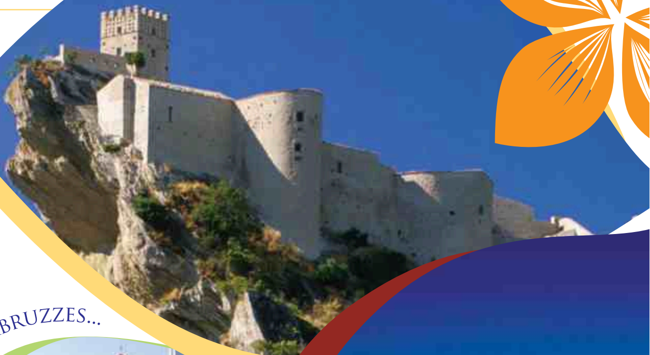
Il Castello di Roccascalegna Roccascalegna Castle