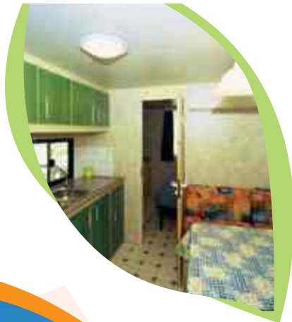
Casa mobile Anemone