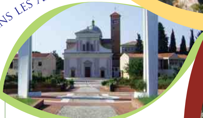
Basilica della Madonna dei Miracoli Basilica "Madonna dei Miracoli"